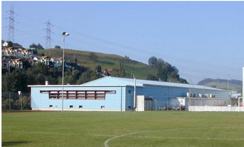
Curlinghalle Küssnacht am Rigi